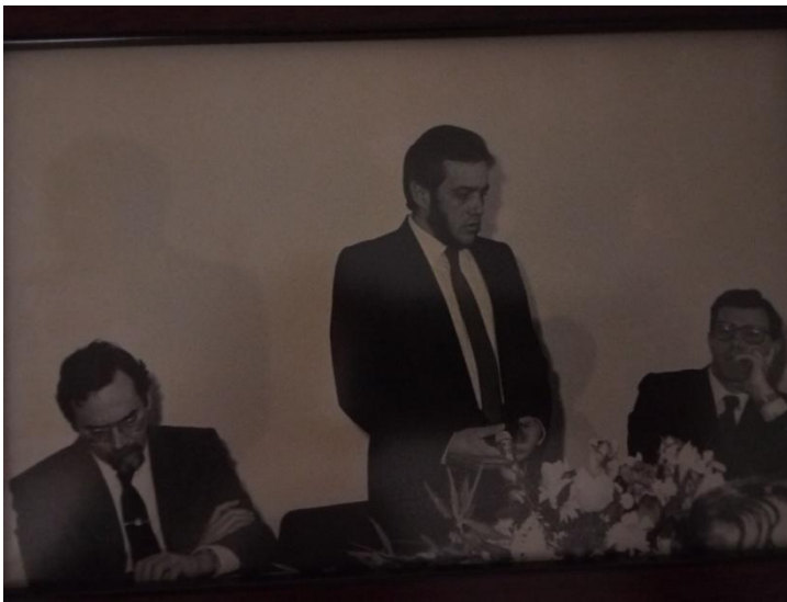
1 Pedro de Silva Cienfuegos-Jovellanos. Presidente del Gobierno de Asturias. Inauguración de FICYT. (Oviedo. 13 de febrero de 1984)

A lo largo de este año, FICYT ha seguido desempeñando su labor de apoyo a empresas, centros de investigación y administraciones, facilitando el acceso a