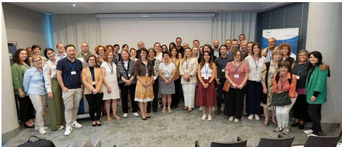
4 Simposio TRANSCAN-3. Catania

2022, organizado en Catania en octubre de 2024. En particular, FICYT dinamizó una sesión de creación de redes destinada a los jóvenes investigadores (ECR) para la promoción de sus carreras investigadoras.