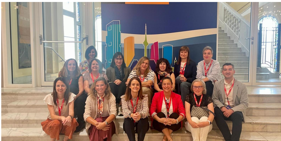
3 Miembros de la EEN-GalacteaPlus en la XVII Conferencia Anual de la Enterprise Europe Network SPAIN. Madrid

Los principales resultados se han traducido hasta la fecha en 13 acuerdos de colaboración finalizados en el año 2024.