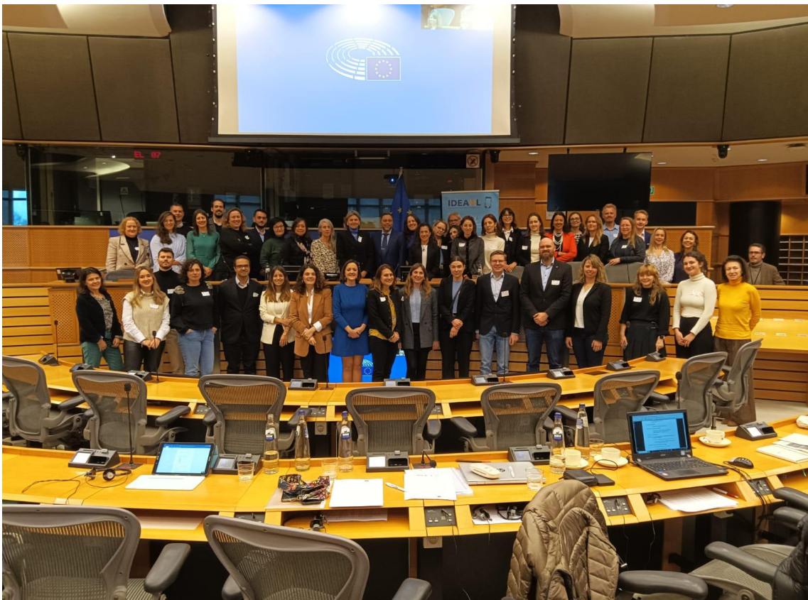
5 Reunión Final del Proyecto IDEAHL. Parlamento Europeo, Bruselas.