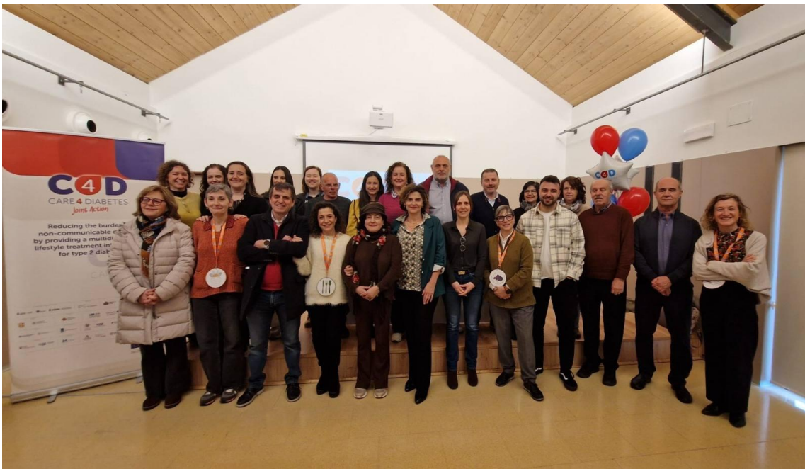
6 Reunión de Formación. Asturias