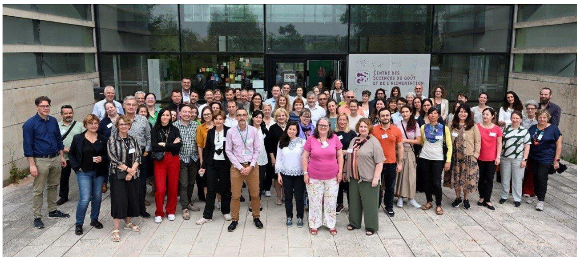
7 FutureFoodS. Kick-off meeting. Dijon